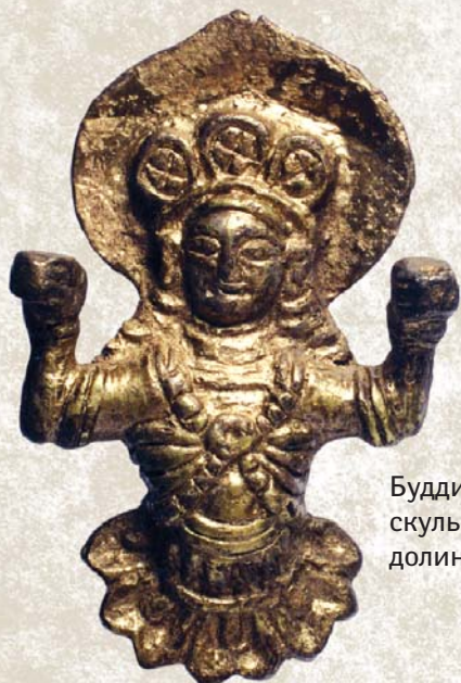
Буддийская бронзовая скульптурка из Чуйской долины. VIII–IX вв.