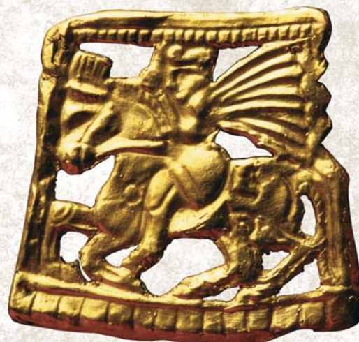
Усуньский всадник, золотая пластинка