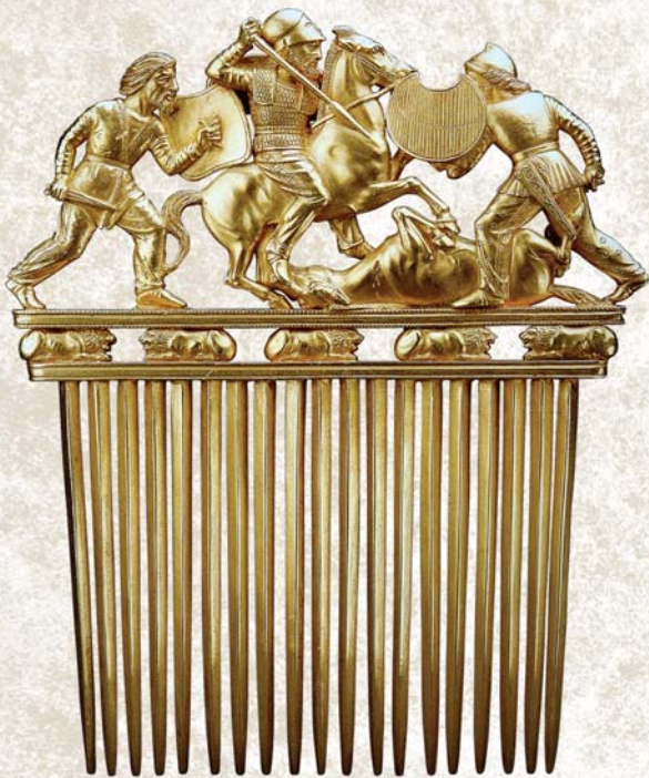
Скифы европейские (золотой гребень)

(возможны варианты: набор магнитиков на холодильник, набор открыток)