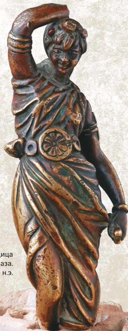
Танцовщица из Тараза. II в. до н.э.