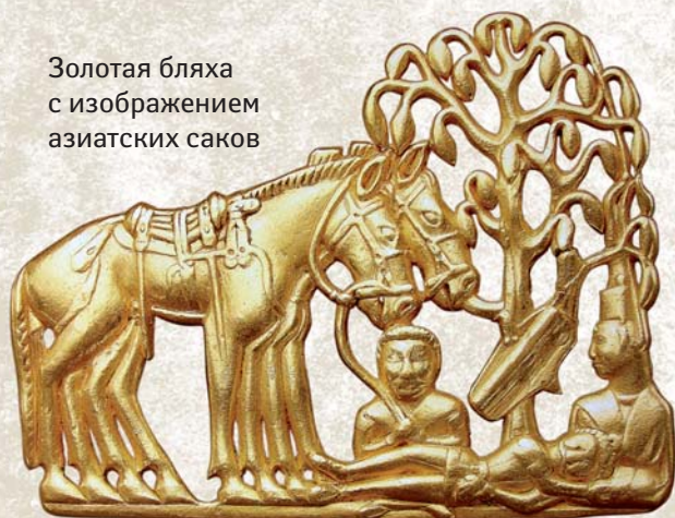
Золотая бляха с изображением азиатских саков