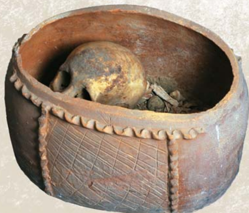
Оссуарий из Тараза. VII–VIII вв.