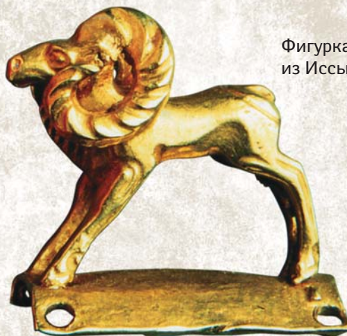
Фигурка архара из Иссыка