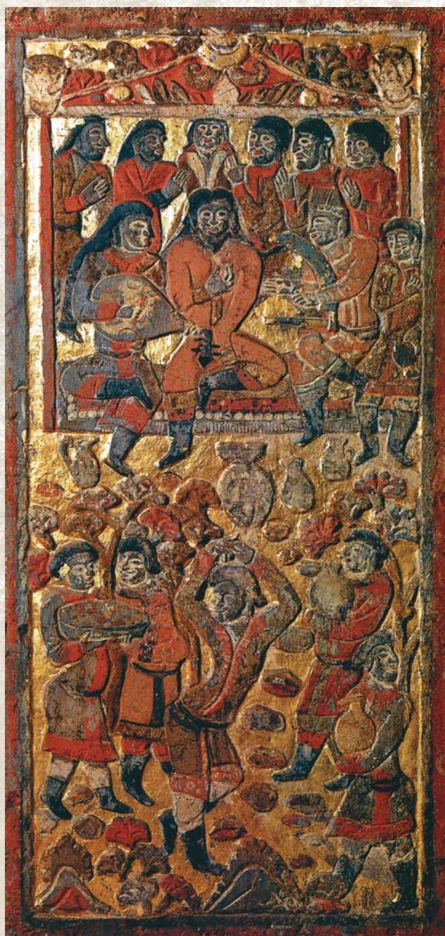
Музыканты и танцоры на торжественном приеме. VI в. н.э.